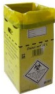
Figure 14 — Exemple de poubelle pour déchets biologiques

Les masques barrières souillés peuvent être jetés dans les poubelles pour déchets biologiques (Figure 15).