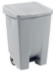
Figure 13 — Exemple de poubelle avec couvercle et à commande non manuelle

Les masques barrières doivent être jetés dans une poubelle munie d'un sac plastique (de préférence avec couvercle et à commande non manuelle, voir Figure 14). Un double emballage est recommandé pour préserver le contenu du premier sac en cas de déchirure du sac extérieur, lors de la collecte.