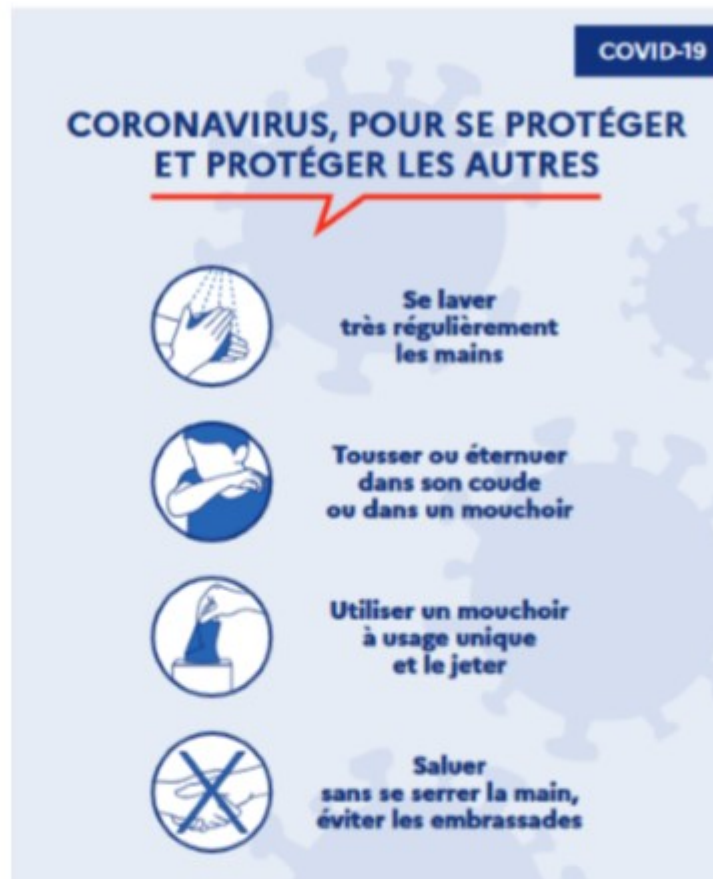
Figure 15 — Gestes barrières COVID-19

Les consignes sanitaires sont présentées sur le site du Gouvernement Français : https://www.gouvernement.fr/info-coronavirus .